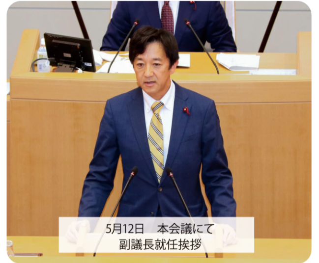
5月12日 本会議にて 副議長就任挨拶

神戸は「海と山が育むグローバル貢献都市」として、未来に向け大きく変貌を遂げていく非常に重要な時期を迎えています。ポストコロナ時代を見据えながら、引き続き市民の命と健康を守り、安心・安全の社会と経済活動の維持・回復に取り組むとともに、スピード感をもって様々な施策に取り組んでいくことが必要です。議会は、市民の代表として、議会活動を通して、未来の神戸のために議論と提案を重ねていかなばなりません。坊議長を補佐し、職責を果たせるよう努力をまいります。