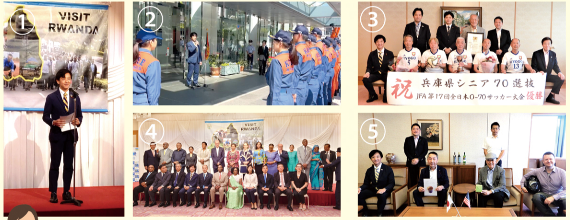
上記の他に、各種団体・企業、在日外交機関などへも訪問、意見交換を行っています。

[7/4] ルワンダ大使館が開催した、ルワンダ共和国解放 29 周年記念レセプションに出席。「2016 年からルワンダと神戸は、ミッション派遣や ICT 分野人材支援での連携を深めており、友好を深めていきたい」と挨拶。(写真①④)