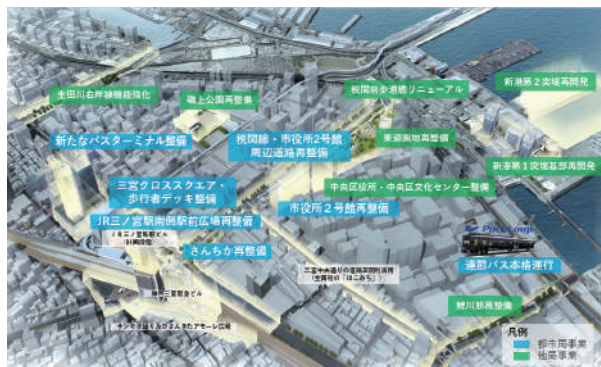
令和4年度 予算説明書より (左) 都心・三宮の再整備 (下) 三宮駅周辺のデッキイメージ

市からも県に『補助金の継続を積極的に働きかけていくべき』と考えますが、ご見解をお伺いします。